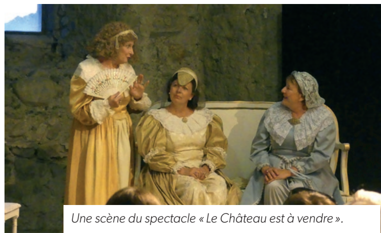
Une scène du spectacle « Le Château est à vendre ».

Nous avons présenté en cette année 2019 quinze spectacles qui ont rassemblé 2 812 spectateurs , et le dimanche 15 décembre, dernier dimanche d'ouverture du Château pour 2019, nous avons passé le cap des 3 000 visiteurs !