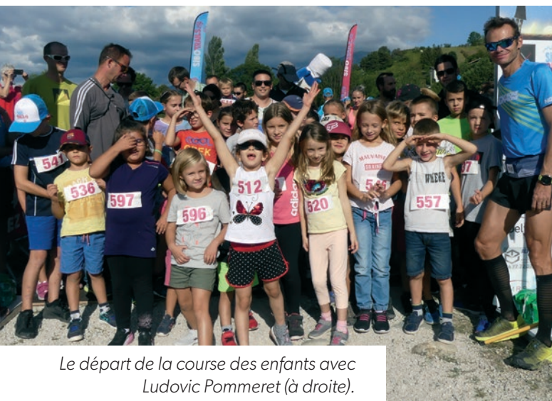
Le départ de la course des enfants avec Ludovic Pommeret (à droite).

Tout cela en présence de Ludovic Pommeret, spécialiste de l'ultra-trail, au palmarès impressionnant : 1 er de l'ultra-trail du Mont-Blanc en 2016 et champion du monde par équipe la même année.