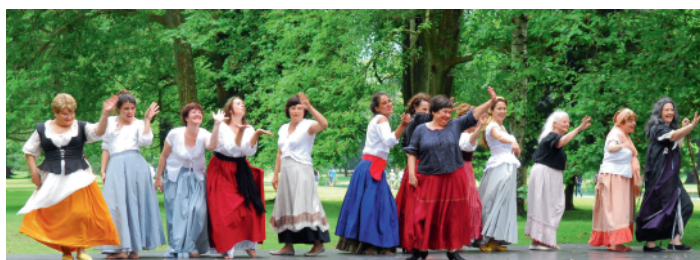
Les Tréteaux de lumières de Vizille.

Et bien sûr, la saison a également connu la poursuite du succès du spectacle de théâtre (visite théâtralisée) « Le Château est à vendre ! » pour 8 représentations et 439 spectateurs, auxquels il faut agréger les 7 représentations et les 409 spectateurs de 2013 : soit un total, à ce jour, de 15 représentations et 848 spectateurs.