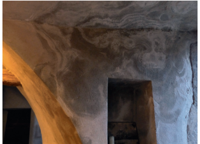
Problèmes d'humidité dans la cuisine et d'infiltration d'eau dans les nouvelles pièces.

Alors, le troisième dimanche de chaque mois (jour du chantier mensuel), nous, les bénévoles de l'Association, nous vérifions, notons et transmettons à la mairie les