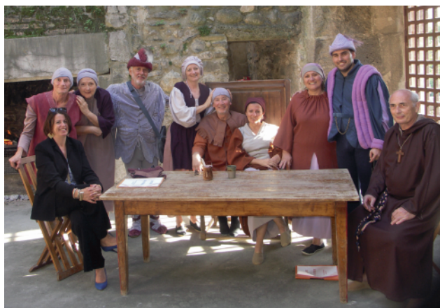
Nouvelle troupe de la Compagnie du Château Ivre pour les visites théâtralisées du "Château est à vendre".